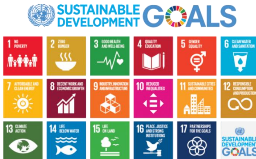
Figura 2: Os 17 Objetivos do Desenvolvimento Sustentável

Os ODS, diferentemente de outras iniciativas de desenvolvimento, não se concentram em um nicho restrito de ações, possuem uma visão holística abordando diferentes dimensões do desenvolvimento sustentável, como pobreza, saúde, educação, mudança climática e degradação ambiental (PRADHAN et al., 2017). Contribuem para o enfrentamento dos principais desafios globais, como a preservação ambiental, crescimento econômico e o bem-estar humano. Porém, é necessário que os ODS se desenvolvam de maneira interativa, compreendendo que não são iniciativas individuais, mas sim uma engrenagem de objetivos que levará a um sistema global mais seguro e justo (PRADHAN et al., 2017). Na Figura 2, são apresentados os 17 ODS: